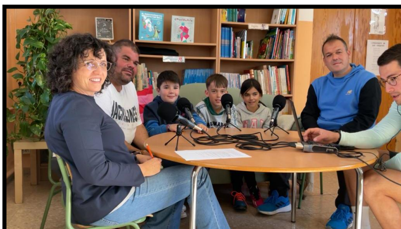
Ilustración 3 “Especial Zambomberos”: Hijos Zambomberos entrevistan a sus padres Zambomberos...